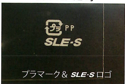
プラマーク & SLE-S ロゴ